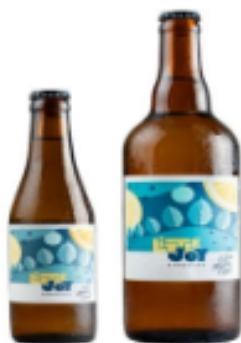
CITRON - MENTHE - TIMUT

Little Joy Kombucha , c'est la pétillance bretonne version bien-être. Installée à Vannes, cette jeune marque artisanale brasse des kombuchas bio aux saveurs originales et rafraîchissantes. Une boisson vivante, naturellement fermentée, riche en probiotiques, sans sucres ajoutés . Little Joy , c'est le plaisir de se faire du bien, à la bretonne.